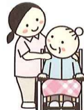
コミュニケーション補助